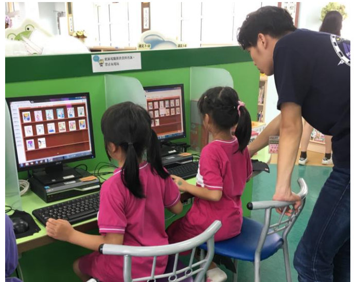
▲小朋友用圖書查詢系統查看自己還沒看過的書籍

而在快要接近放學的最後半小時，他們便會讓小朋友們在走廊排隊，帶他們到操場玩捉迷藏、鬼抓人等遊戲獎勵他們認真的看書，也讓他們放鬆一下再放學，做個快樂的結尾。