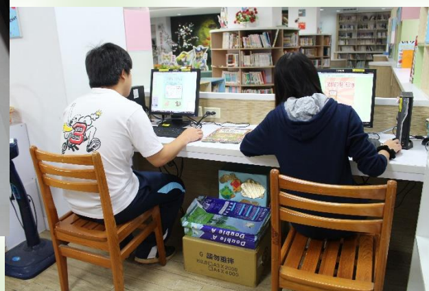
▲ 開始海報製作的圖書組同學