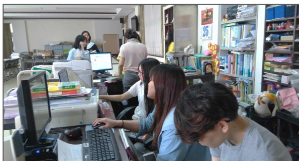
▲（圖一）資圖系同學正討論英文編目問題

由於這次是由國外所捐贈的書籍，皆為全英文圖書，也是資圖系同學第一次實際挑戰全英文書籍的編目。資圖系同學表示一開始編目的時候有點困難，由於系上的關於英文編目的課程在大二的時段，記憶有些許模糊，再加上全英文書籍在找尋作者及書目資料的時候，對於我們來說相對較不能迅速找出書目資料，且 NBINet 的網站中有部分書籍沒有資料，因此檢索起來較為不便，所花的時間與中文相比可能耗費較多一點時間。不過同學們也表示對於全英文書的編目這項挑戰，讓同學們獲得更多的經驗，學習到更多知識。