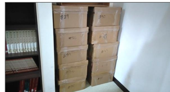
▲（圖三）由美國慧智文教基金會捐贈之書籍