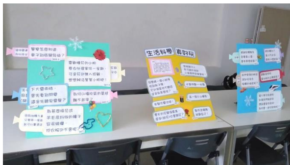
▲ (圖一)「生活科學」活動看板

淡江資圖系同學們表示，進行了一整個學期的學習後，已經對許多圖書館基本的工作有一定的了解，在執行的過程中相對熟悉很多，也能夠獨立完成交代的作業，不過還是有遇到一些問題，像是這次的編目，雖然上學期已經有經驗了，但有時候還是會遇到找不到書籍資訊、ISBN 的問題，所以還需要多加學習、累積更多實作經驗。