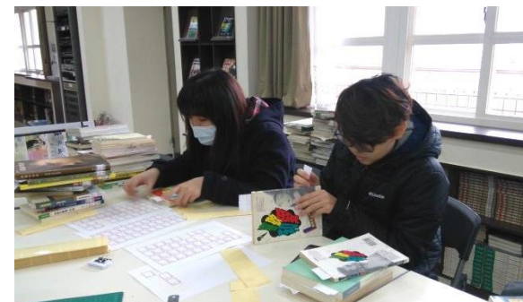
▲ (圖三) 同學們在為書籍貼標籤