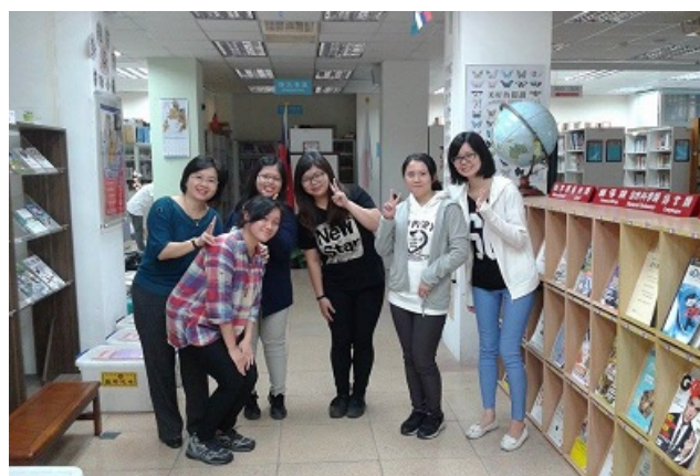
▲ 最後和主任(左一)的合照，感謝您這一學年的照顧！