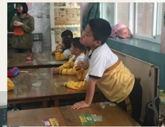
← 情緒有點激動的小朋友