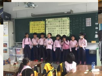
→ 第一次到文化國小時的上課情況