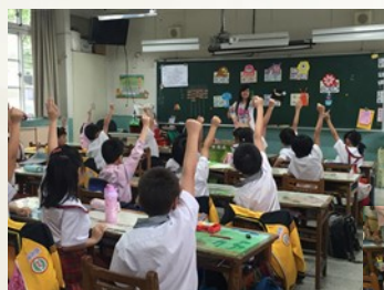
← 小朋友在舉手回答問題

在最後一次到文化國小上課，三組同學跟平常一樣，努力地進行教案，解答小朋友的發問。在第一節課結束後，沒課的同學沒有像以往一樣走到圖書館休息，反而不斷留在教室外的休息區拍照，為他們最後的實習留下值得回憶的照片。