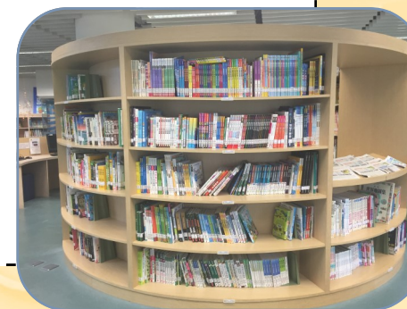
※ 新市國小圖書館內的書架