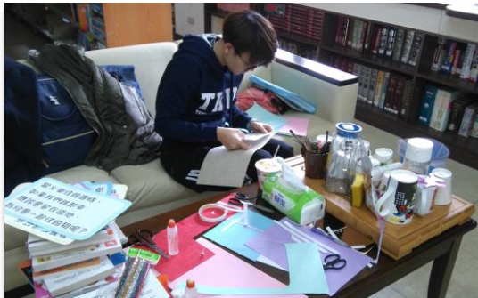
▲ (圖二)(圖三) 同學們在製作新書展看板