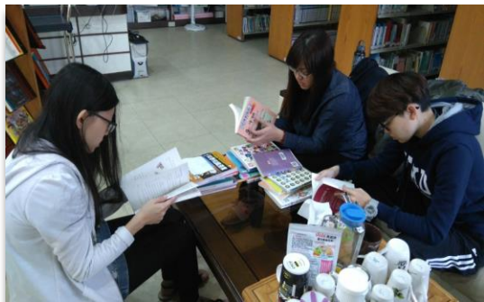
▲ (圖一) 同學們在設計題目