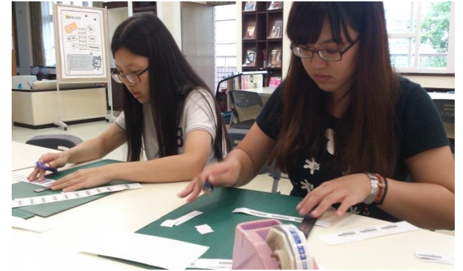
▲ (圖二)實習生們在貼索書號條碼

在做書目抄編的過程中，實習生們也遇到一些的小問題，像是外國作者有中譯名稱時，到底是要依作者原文名編作者號呢？還是要以中譯名編作者號？透過這些摸索的過程，相信資圖系的同學們一定能更增進不少實務上的經驗。