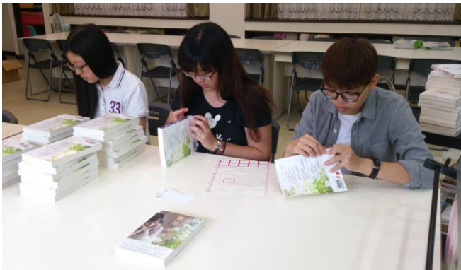
▲ (圖一)實習生們在貼書標

記者今日來訪淡水的正德國中國圖書室是位於正德國中右側大樓的三樓角落，一進入圖書室後，就可以一目了然的看到整個圖書室的內部，裡面環境舒適明亮，整間圖書室的大小呢，大約是兩間教室的長度，左手邊是圖書室的流通櫃台和書架，右邊則是兩排大大的長桌，可以在那邊閱覽，雖然圖書室的空間不是很大，但五臟俱全，許多熱門的暢銷書籍在這