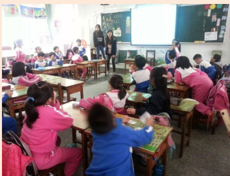
▲ 舉答案牌的小朋友們