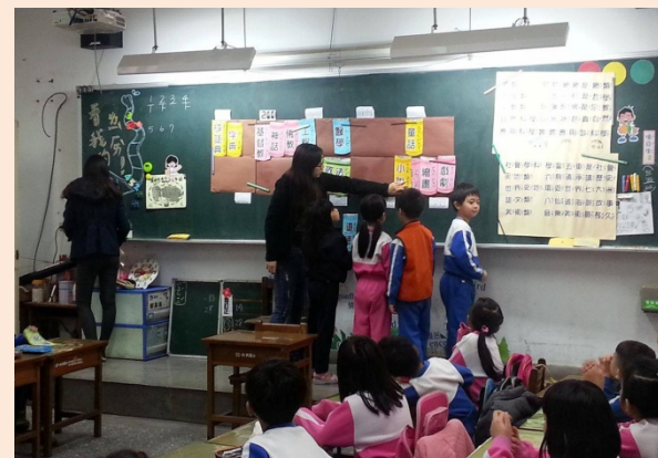
▲ 正在分類書的小朋友們