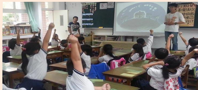
小朋友們踴躍發言