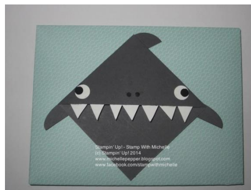
▲ 圖二 Corner bookmark